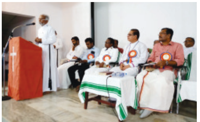
രജതജൂബിലി ആഘോഷങ്ങളുടെ സമാപനസമ്മേളനം