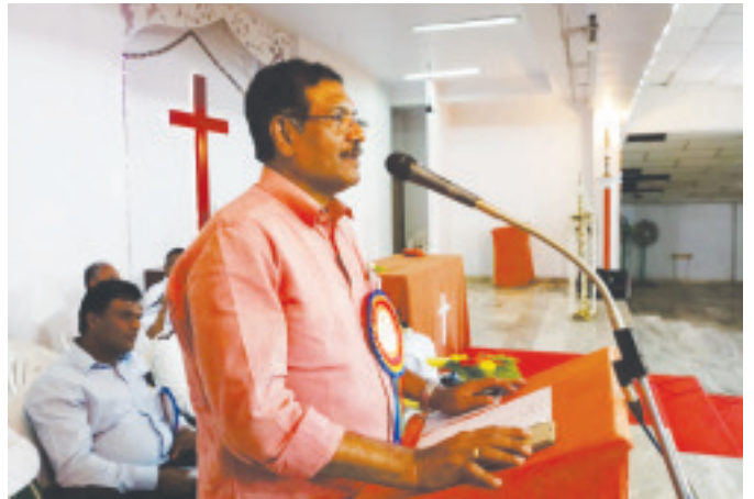
ഡോ. എ. സമ്പത്ത് എം.പി. സമാപനസമ്മേളനം ഉദ്ഘാടനം ചെയ്യുന്നു